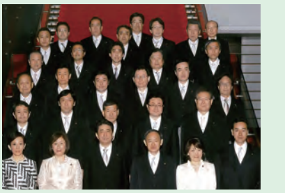
▲防衛副大臣 兼 内閣府副大臣を 再度拝命(H26年12月)