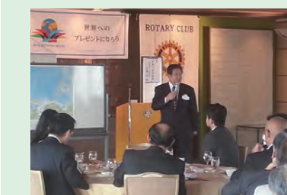
▲日本の安全保障について講演 大阪船場ロータリークラブにて(H28年4月)