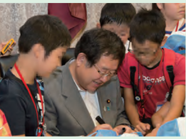
▲子供達からサインをもとめられる 左藤副大臣(H27年8月)