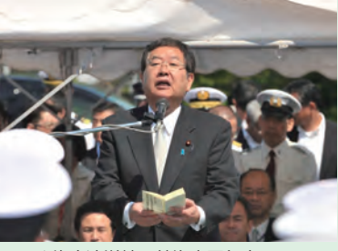
▲海自遠洋練習航海出国行事にて 防衛副大臣として挨拶(H27年5月)