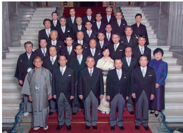
▲衆議院 委員長就任式

わが国を取り巻く安全保障環境は、北朝鮮の核実験に続くミサイル発射、中国による南シナ海(西沙諸島)への滑走路建設など一連の軍事拠点化の動きにより一層厳しさを増しております。米国、豪州、ASEAN諸国、韓国などと情報の共有、連携を深め極東の安全保障のため、力を注いで参ります。