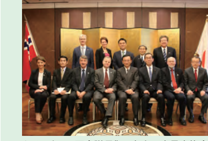
▲ノルウェー国会議長御一行との意見交換会 (H28年3月)