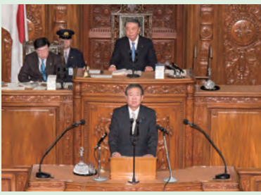
▲衆議院本会議にて安全保障委員長報告(H28年1月)