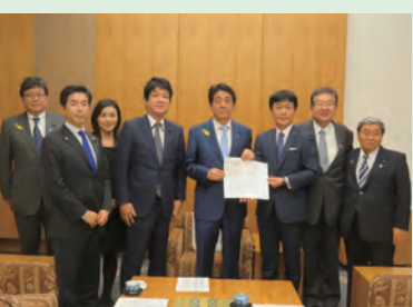
▲自民党展示会産業議員連盟にて 安倍総理に申入れ(H27年12月)