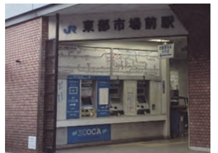
▲現在の東部市場前駅の改札