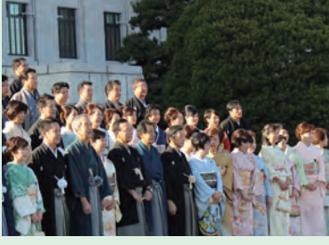
▲第190回通常国会開会に際し 着物姿で記念撮影(H28年1月)