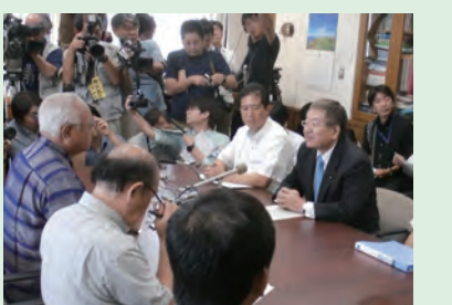
▲防衛副大臣として宮古島・石垣島出張 (H27年5月)