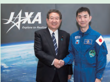
▲油井亀美也JAXA宇宙飛行士と(H28年2月)