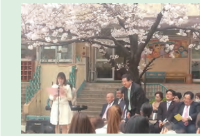
▲入園式にて皆さまにご挨拶(H28年4月)