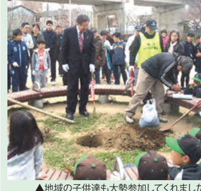
▲地域の子供達も大勢参加してくれました