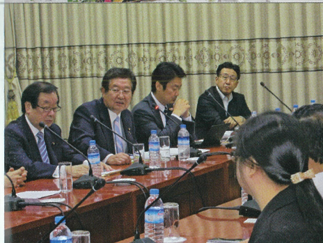
自民党日本・ミャンマー 友好議員連盟にて ミャンマー訪問 チョウ・ティン・スエ国家 最高顧問府大臣との 意見交換