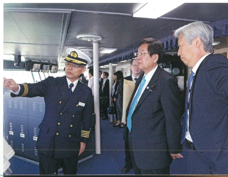
海底広域研究船「かいめい」を視察