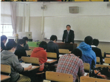
18歳選挙について 大学にて学生たちと 意見交換