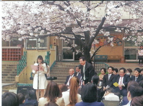
幼稚園の入園式にて祝辞