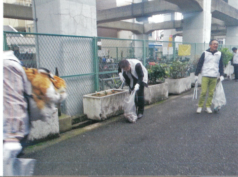
翠章会の皆さまと地域のグリーン活動