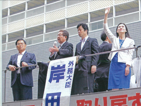
参議院選挙にて 応援演説