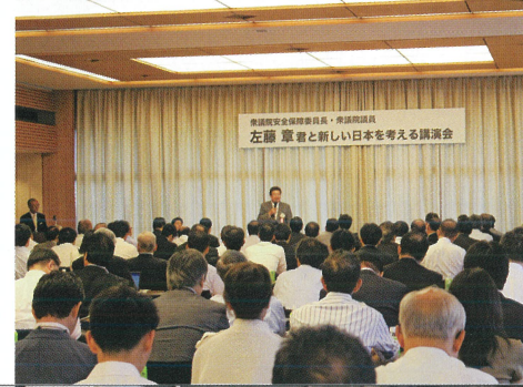
憲政記念館にて「新しい日本を考える講演会」開催