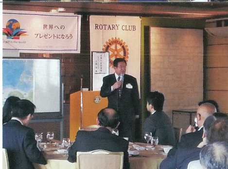
大阪船場ロータリー クラブ主催 「日本の安全保障」 について卓話