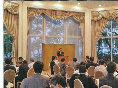
大阪経営者懇話会主催 早朝講演会にて 「大阪再生」について講演