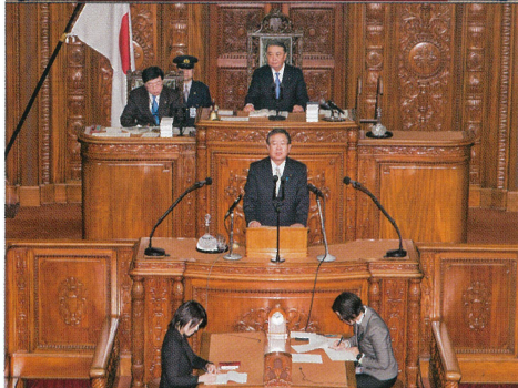
本会議場にて 安全保障委員長報告