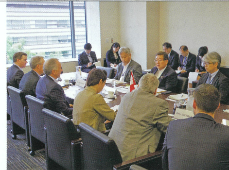
安全保障委員長として 訪日カナダ国会議員 表敬受け