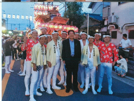
地域の夏祭りにて 地元の皆さまと