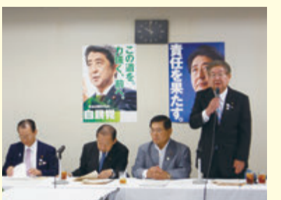
▲自民党万博誘致推進本部にて 事務局長代行として司会進行 (H29年6月)