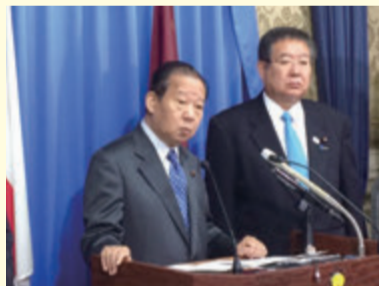
▲副幹事長として幹事長記者会見にて (H29年1月)