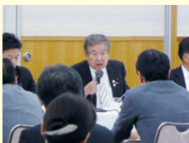
▲大阪市・府予算要望にて発言 (H29年6月)

現在、有効求人倍率が全国平均1.52で、大阪は1.60と確実に景気が良くなっている中、人手不足の解消や賃金上昇はあまり見られず、必ずしも誰もが実感ができる回復とは言えません。確実に日本経済を再生するために、アベノミクス新三本の矢を推し進め、かつ、働き方改革、人づくり革命に引き続き力を入れ、人にやさしい政治を目指します。また、北朝鮮のミサイル発射や核実験、中国の尖閣諸島への侵入などに対し、日米同盟を基軸として外交・防衛力を強化し、断固として日本の領土・領空・領海、そして国民の生命と暮らしを守ってまいります。