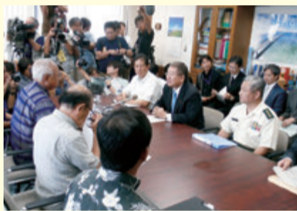
▲防衛副大臣として宮古島・石垣島出張 (H27年5月)