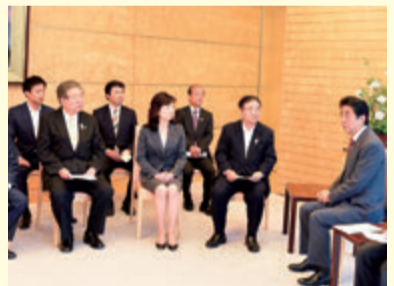
▲サイバーセキュリティ対策推進議連 「骨太方針2017」提言を安倍総理へ申し入れ (H29年5月)