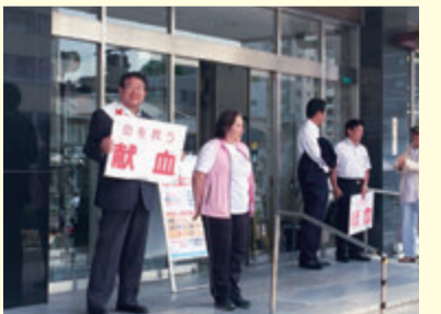
▲大阪阿倍野ライオンズクラブ3クラブ合同 献血キャンペーンにて (H28年9月)