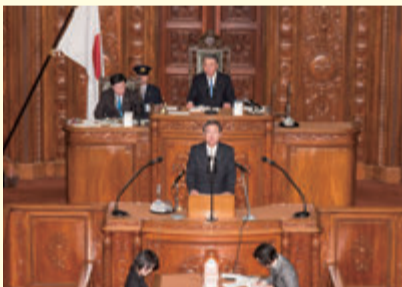
▲衆院本会議にて安全保障委員長報告 (H28年1月)