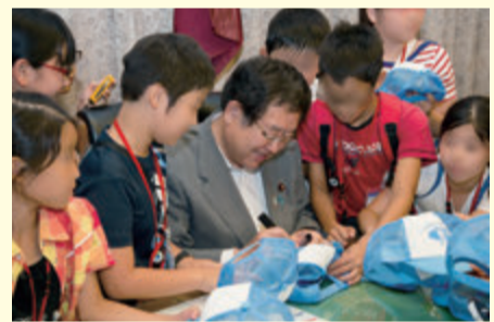
▲子供達からサインをもとめられる左藤副大臣 (H27年8月)