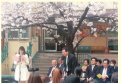
▲入園式にて皆さまにごあいさつ (H28年4月)