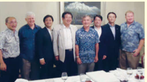
▲安全保障調査議員派遣にて団長として訪米 ハリス米太平洋軍司令官と意見交換 (H28年7月)