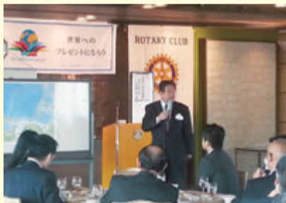
▲日本の安全保障について講演 大阪船場ロータリークラブにて (H28年4月)