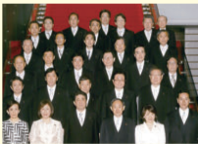
▲防衛副大臣兼内閣府副大臣再度拝命 (H26年12月)