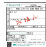
交付申請書のQRコード