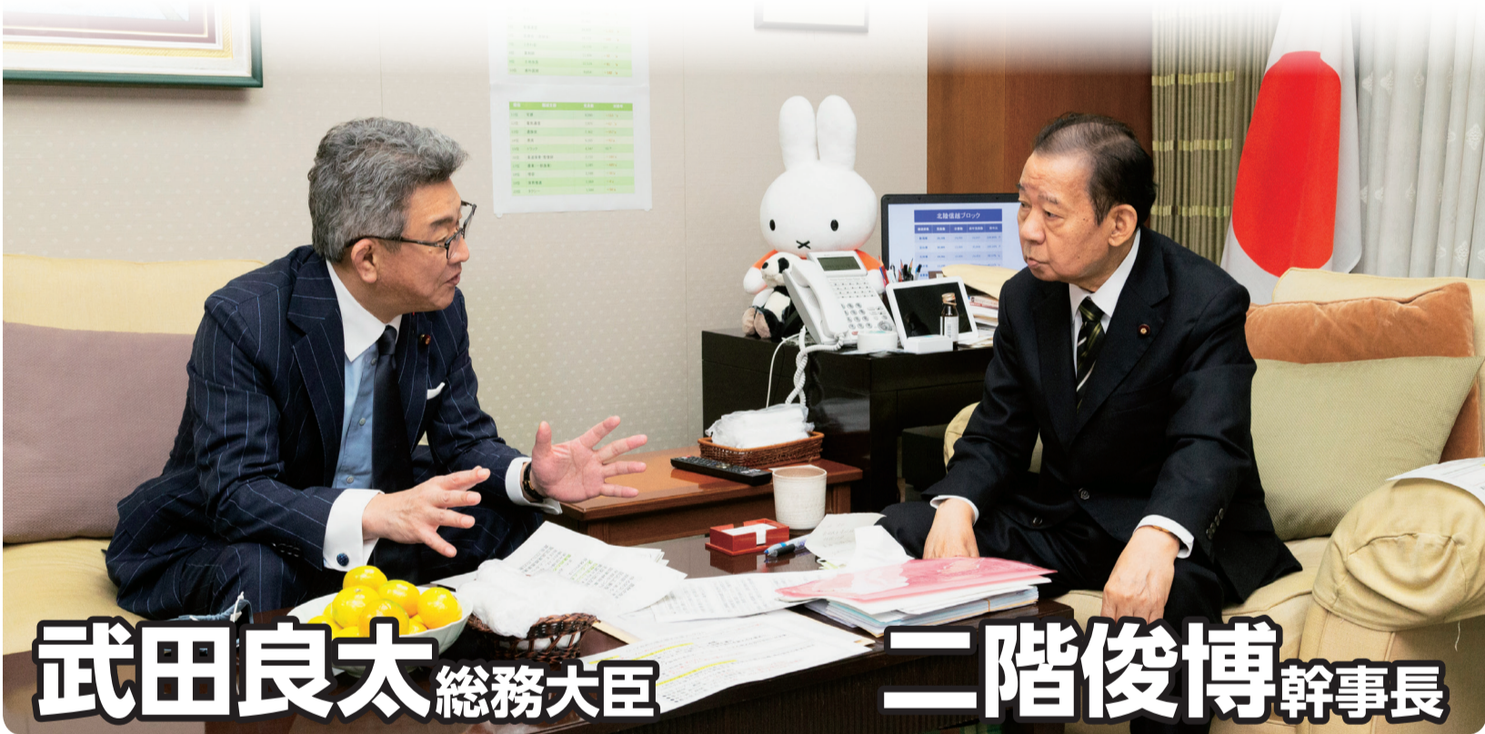
武田良太 総務大臣

さらに、行政や民間の手続きで使っても、税や年金などの情報はカードに記録されず、情報や税務当局などに伝達されることもありません。