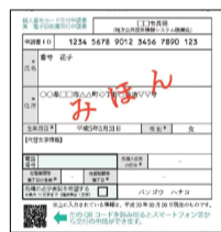
交付申請書のQRコード