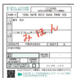
交付申請書の申請書ID